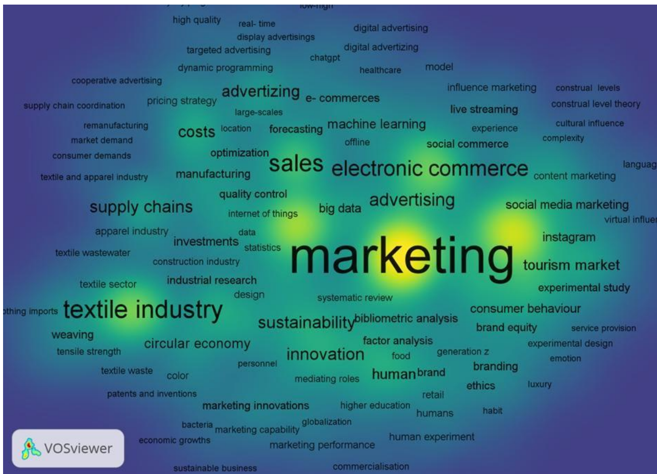
Illustration 3: Densidad de la visualización

Nota. La fuente es el programa de redes bibliométricas: Vosviewer